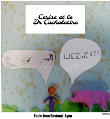
Ecole Jean Rostand - Lyon